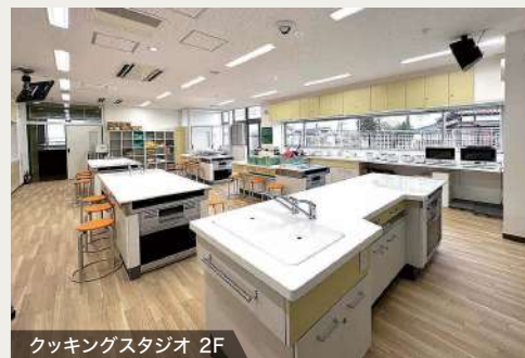
クッキングスタジオ 2F