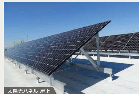
太陽光パネル 屋上