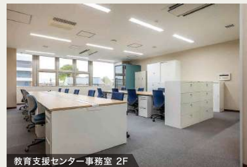
教育支援センター事務室 2F