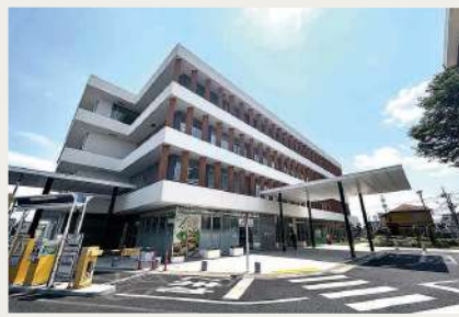
隣接する清瀬市役所新庁舎

清瀬市しあわせ未来センター(旧清瀬市健康センター)は、平成元年3月に健康センターとして竣工し、市民の健康を守る拠点として長く地域に根差している施設です。本施設は竣工当時から大きな改修を行うことなく、築後30年以上が経過しているため、建物や設備機器の老朽化及び劣化が著しくなっていました。今回、老朽化した建物について、物理的な不具合を直し建物の耐久性を高めることに加え、建物の機能や性能を、現在に求められている水準まで引き上げる改修計画としました。また、同一敷地内には令和4年に竣工した清瀬市役所新庁舎があり、プロムナードによって本施設と接続するため、2つの建物が調和するように改修を行うこととなりました。新しく生まれ変わった本センターから子育てが楽しいまちづくりが始まります。