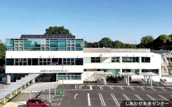
しあわせ未来センター