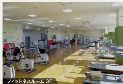
フィットネスルーム 3F