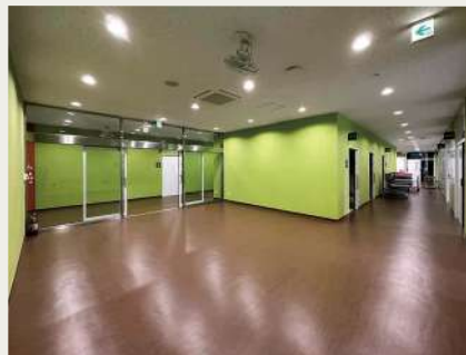
明るいグリーン色で統一されたフロア