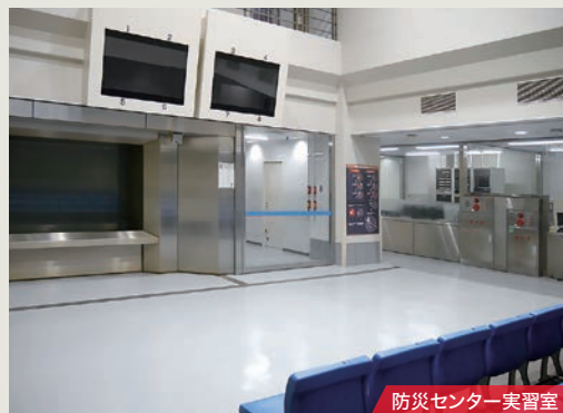
防災センター実習室