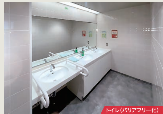
トイレ(バリアフリー化)