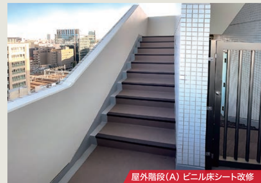
屋外階段(A) ビニル床シート改修