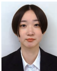
(株)久慈設計 東京支社 建築設計部 主査